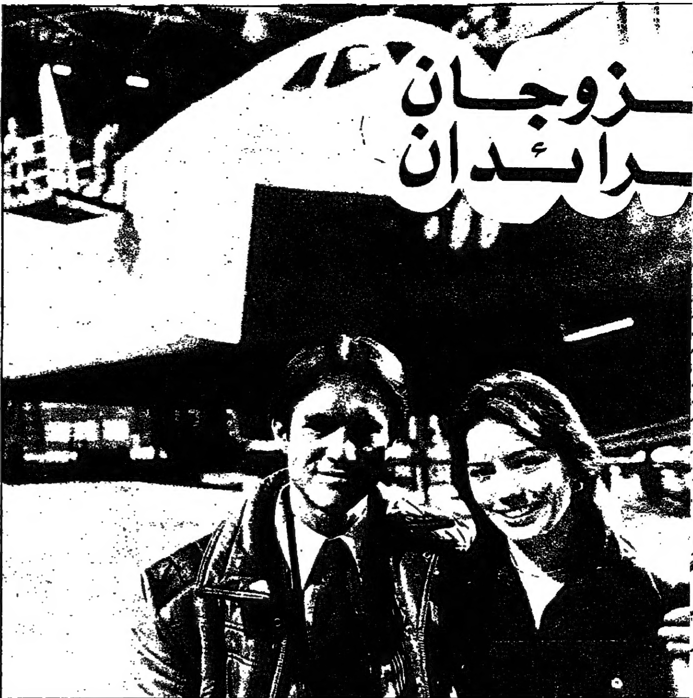
الزوجان خارج مركز التدريب

لكن لم يلبث ان انطفأ فتبدل الضياء الذي كان يضيء ليالي اليمن بالعلم والمعرفة ويجب لها السعادة .. وواجهت اليه من السعادة اياما وسنوات عجايفا رجعت فيها الى الوراء مُنمات السنين ، وكانت حضارة الماضي ان تندر وتنتهي لسولا قيس الضياء الذي جاء من الحاضر . لولا الايل الياسم الذي حمله وعاد